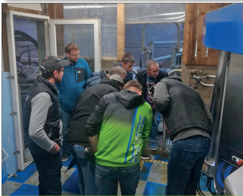
Découverte de la dernière génération de robot de traite DeLaval V300.