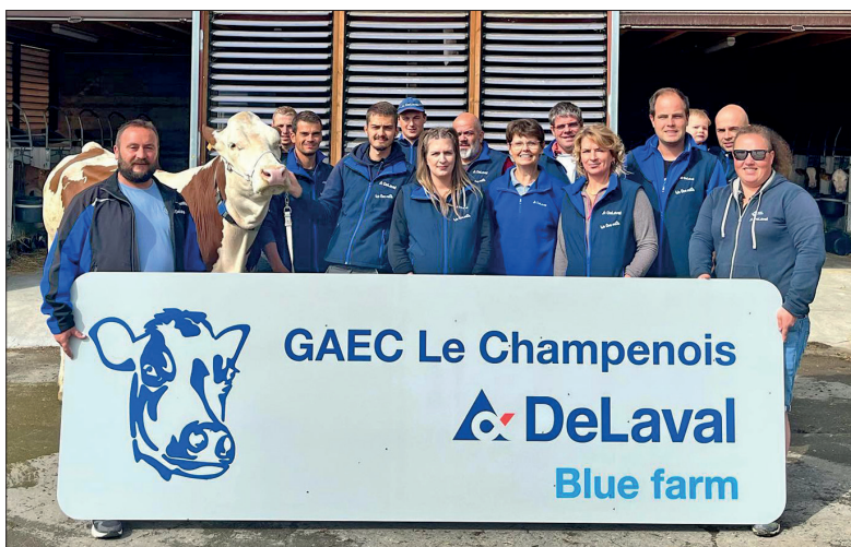
Toute l'équipe du GAEC Le Champenois, associés et salariés.

Enfin le public a pu découvrir les caméras DeLaval BCS : ces caméras permettent une surveillance de l'état corporel des vaches afin d'optimiser l'alimentation et le suivi des cycles de l'animal.