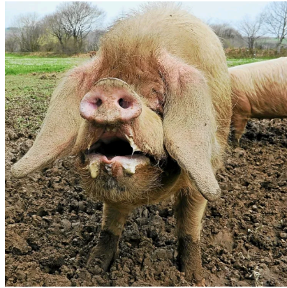
Cochon présentant des symptômes de fièvre aphteuse

Ces lésions entraînent une salivation, une anorexie, des boiteries et chutes de production. Les animaux pourraient en guérir tout en restant porteur (plutôt bénin chez les adultes, et c'est pour cela qu'on les abats) mais peut être mortelle chez les jeunes.