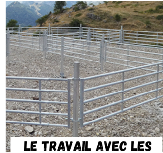
LE TRAVAIL AVEC LES ANIMAUX : MANIPULATION ET CONTENTION