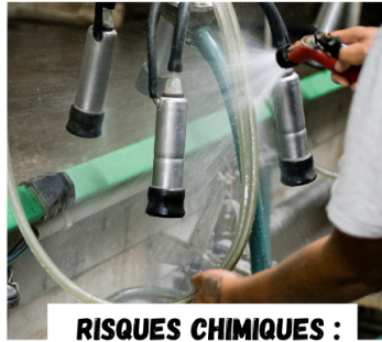
RISQUES CHIMIQUES : ÉVALUATION ET PRÉVENTION